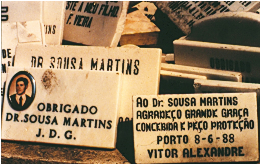
Fig. 7: Placas ao Dr. Sousa Martins, Foto do autor.

Permita-se-me uma comparação com a actualidade, partindo eu do pressuposto que a mentalidade humana não sofre mui sensíveis alterações ao longo dos tempos: as placas de agradecimento que os devotos do Dr. Sousa Martins — médico dotado de um halo taumatúrgico, a que muitos recorrem. Que vemos? (fig. 7). Nem sempre o nome do médico é referido, nem sempre o devoto se identifica ou, quando se identifica, usa siglas ou nomes próprios que o não permitem reconhecer.