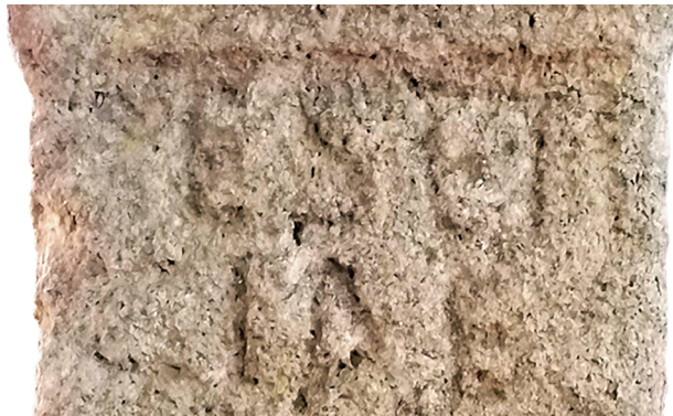
Figs. 5 e 6: Ara a Besencla e pormenor do teónimo.