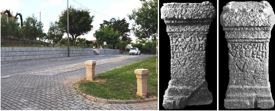
Fig. 1: As aras no jardim. Figs. 2 e 3: As outras aras.

blico em Carvalhal Redondo (figs. 1 a 3). Pela identidade do texto e da forma saíram ambos da mesma oficina. E rapidamente se concluiu serem as aras que João Vaz estudara, encontradas na parede dum lagar.