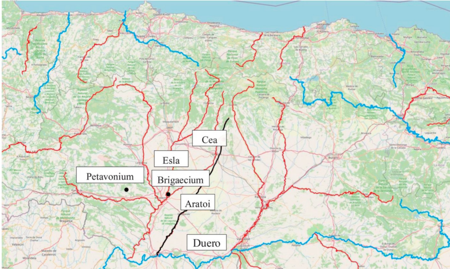
Fig. 1. Área de estudio.

numeral nueve (< növe(m) ), en un contexto aparentemente idéntico, sin que, hasta la fecha, se haya dado, en mi opinión, una explicación satisfactoria de este tratamiento diferente. 3