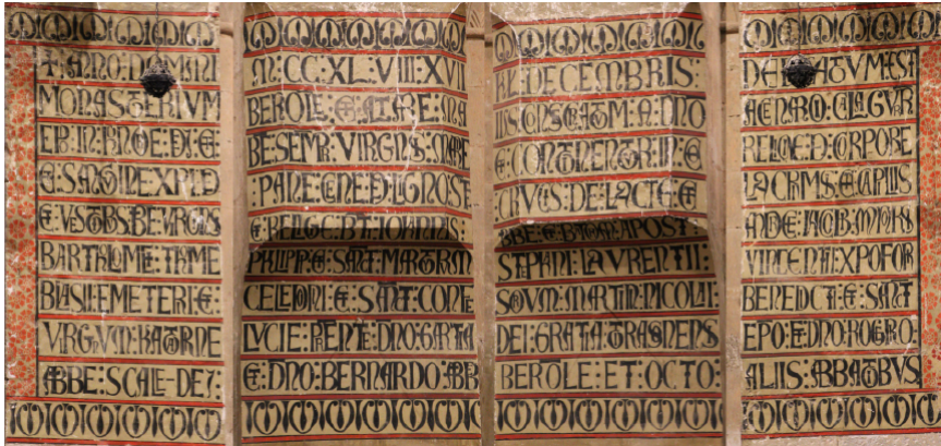
Fig. 13. Santa María de Veruela, inscripción del altar mayor (nº 7).

// 8 Lucie] et Lucie acta 1ª ; Gartia] G. acta 1ª ; Rogerio] R<ogerio> add. interl. acta 1ª // 9 Bernardo] B. acta 1ª ; berol(ens)e] Berole acta 1ª ; abbatibus] de Sacramenia, de Fiterio, de Portaglonio, de [Oliva], de Monte Salutis, de Buxeto, de Sancto Prudencio, de Ferraria add. marg. acta 1ª .