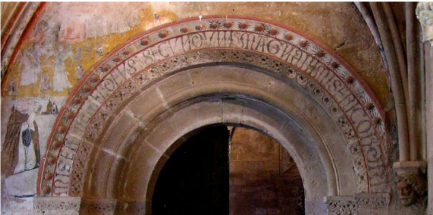
Fig. 1. Santa María de Veruela, capilla mayor. Fig. 3. Santa María de Veruela, puerta del Miserere.

El núcleo de la colección verolense lo constituían un mínimo de diez inscripciones de consagración bellamente pintadas en las paredes de cierre de los altares erigidos en la iglesia entre 1168 y 1251 (Figuras 1-2). De éstas conservamos seis en mejor o peor estado, todas in situ (nº 1, 3, 5-8) 6 ; de las cuatro restantes, sólo nos ha llegado el texto de una (nº 2) gracias a la transcripción de quien todavía pudo leerla en la