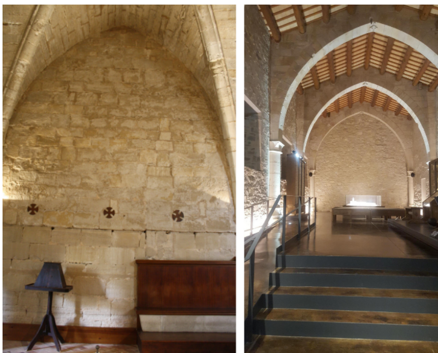
Fig. 10. Vallbona de les Monges, Lleida. Monasterio de Santa María de Vallbona. Sala Capitular. Muro norte. Detalle de los soportes retirados. Fig. 13. Vallbona de les Monges, Lleida. Monasterio de Santa María de Vallbona. Claustro. Galería oriental. Dormitorio meridional.

vía se aprecian en los lienzos bajos del transepto y en los primeros tramos de la nave, aunque a veces adquieren mayores dimensiones que los símbolos idénticos con que se rubrican los sillares en los ábsides laterales. Un cambio en las dimensiones y en la talla de las mismas marcas de cantería a menudo indicaba que el relevo había sido tomado por otros miembros de la familia que perpetuaban el signo familiar. Que el inicio de las obras en las dependencias claustrales fuera anterior a la terminación de todo el perímetro de la iglesia tal y como fuera acostumbrado, podría estar justificado por la urgencia de celebrarse en Vallbona reuniones importantes. Un ejemplo significativo sería la que tiene lugar justo después de 1227 y en la que el abad de Fontfroide preside el primer Capítulo General de abadesas cistercienses de la Corona de Aragón. 74