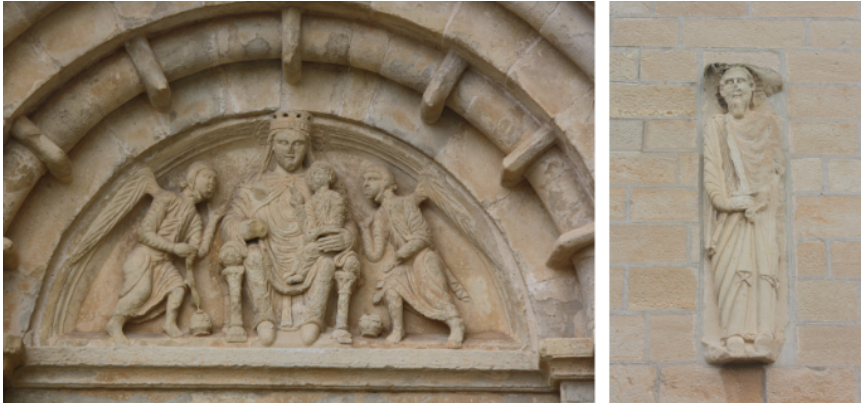
Fig. 17. Vallbona de les Monges, Lleida. Monasterio de Santa María de Vallbona. Iglesia. Transepto. Brazo norte. Fachada occidental. Portal. Tímpano.