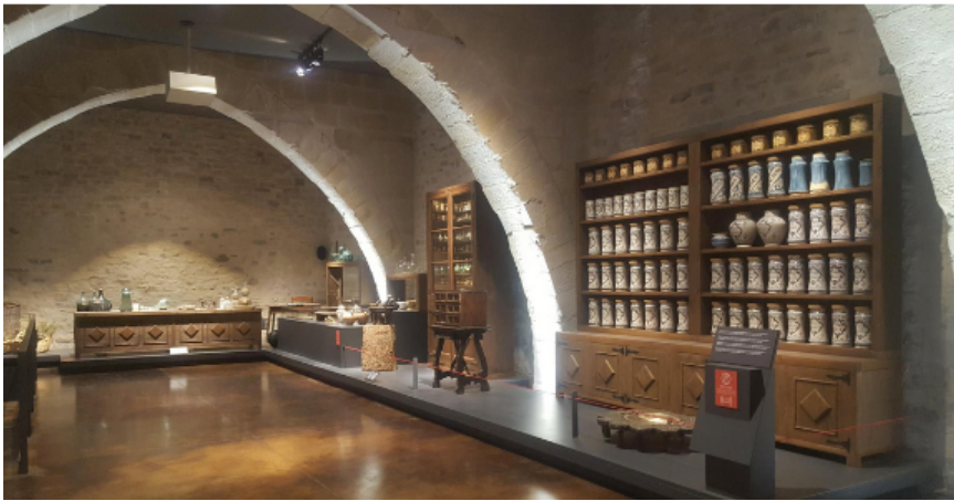
Fig. 08. Vallbona de les Monges, Lleida. Monasterio de Santa María de Vallbona. Claustro. Vista interior de la sala capitular. Fig. 12. Vallbona de les Monges, Lleida. Monasterio de Santa María de Vallbona. Claustro. Galería oriental. Dormitorio septentrional.

colaterales. Además, al pertenecer los soportes retirados a la pared que constituye los dos primeros tramos de la iglesia, se podría suponer que la sala capitular podría haber sido construida al compás de los primeros tramos de las naves del templo [fig. 10]. De hecho, en la pared oriental comparecen las mismas marcas en flecha y cruz antes mencionadas [fig. 11]. Son marcas, por tanto, afines a las que toda-