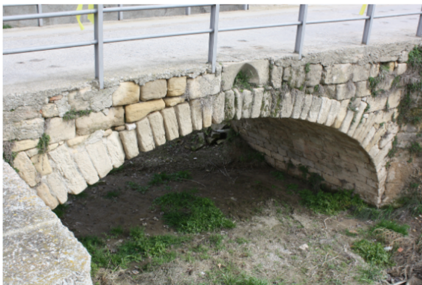
Fig. 01. Vallbona de les Monges, Lleida. Monasterio de Santa María de Vallbona. Vista general. Foto: Autora. Fig. 02. Vallbona de les Monges, Lleida. Puente de la calle Sant Bernat, con sillares reaprovechados de Santa María la Vella . Foto: Autora.