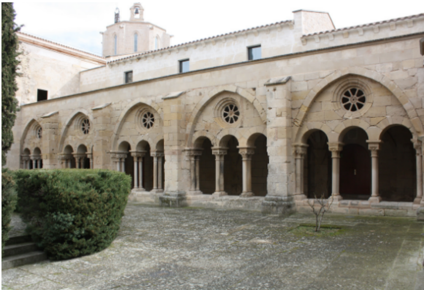
Fig. 11. Vallbona de les Monges, Lleida. Monasterio de Santa María de Vallbona. Sala Capitular. Muro este. Detalle de las marcas de cantería. Foto: Autora. Fig. 14. Vallbona de les Monges, Lleida. Monasterio de Santa María de Vallbona. Claustro. Galería oriental. Foto: Autora.