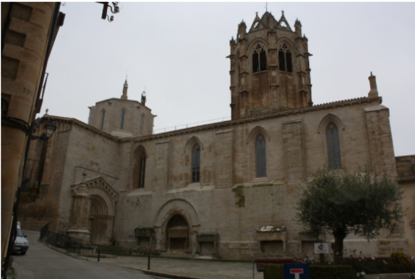
Fig. 03. Vallbona de les Monges, Lleida. Monasterio de Santa María de Vallbona. Planta. Adaptación a partir de la planta levantada por el Museu d'Història de Catalunya: Autora. Fig. 04. Vallbona de les Monges, Lleida. Monasterio de Santa María de Vallbona. Vista del antiguo fosar de las monjas.