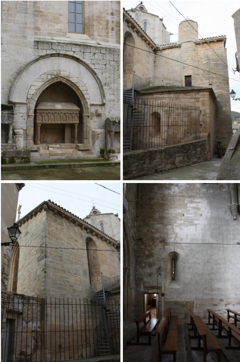
Fig. 05. Vallbona de les Monges, Lleida. Monasterio de Santa María de Vallbona. Iglesia. Fachada norte. Portal. Foto: Autora. Fig. 06. Vallbona de les Monges, Lleida. Monasterio de Santa María de Vallbona. Iglesia. Ábside lateral norte. Foto: Autora. Fig. 07. Vallbona de les Monges, Lleida. Monasterio de Santa María de Vallbona. Iglesia. Ábside mayor. Foto: Autora. Fig. 09. Vallbona de les Monges, Lleida. Monasterio de Santa María de Vallbona. Iglesia. Transepto. Brazo sur. Fachada occidental. Detalle del vano en el nivel bajo. Foto: Autora.