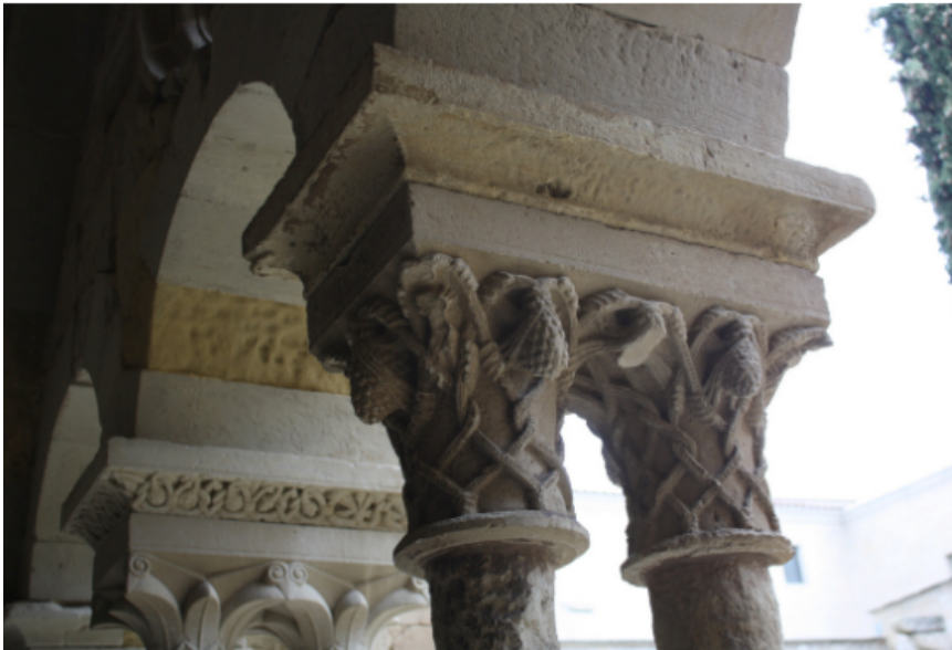
Fig. 15. Vallbona de les Monges, Lleida. Monasterio de Santa María de Vallbona. Claustro. Galería meridional. Foto: Autora. Fig. 16. Vallbona de les Monges, Lleida. Monasterio de Santa María de Vallbona. Claustro. Galería oriental. Capiteles. Foto: Autora.